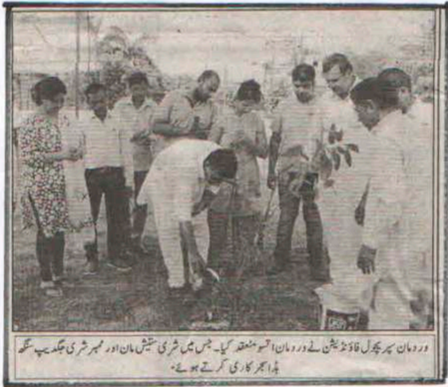
وردان پروگرام کے دوران اسی موقعہ پر۔ جس میں شری تیش مان اور مہر شری جگدیپ سنگھ پہا بھکاری کرتے ہوئے۔